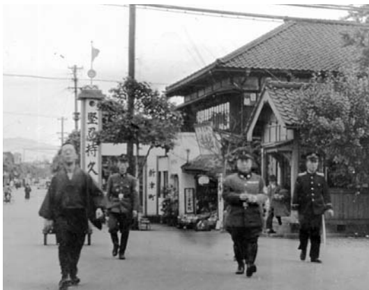
上山町警防団十七名と新潟県新津町へ団長として視察訪問した折の高熊(右より二人目)。昭和十と十五年頃か。

高熊は大正十三年、衆議院議員に当選するが、昭和三年二月二十日、昭和五年二月二十日、昭和七年二月二十日