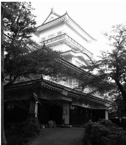
秋田城(=久保田城)御隅櫓(復元)

一行途上でのお宿として宿場町がある。蔵王温泉、上山温泉もその一つであった。殿の命により途上に住みついた武士もいたと言うから、その説も伺える。