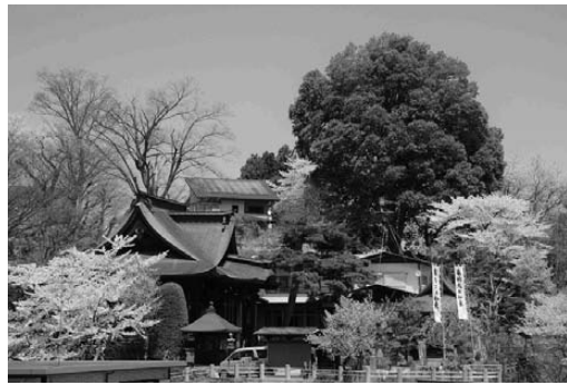
桜の観音寺（稲毛孝）

不眺望策による移設で台地頂上にシラカシが生えたとすれば最長三四〇年の大木ということになります。市教育委員会はシラカシ北限の貴重なブナ科コナラ属常緑高木（幹周三・八m、樹齢二五〇年以上、樹高十八m、後の実測樹高二十五m）の天然遺産文化財として指定しました（平成二十七年十一月）。なお樹齢等については更に検証が必要です。