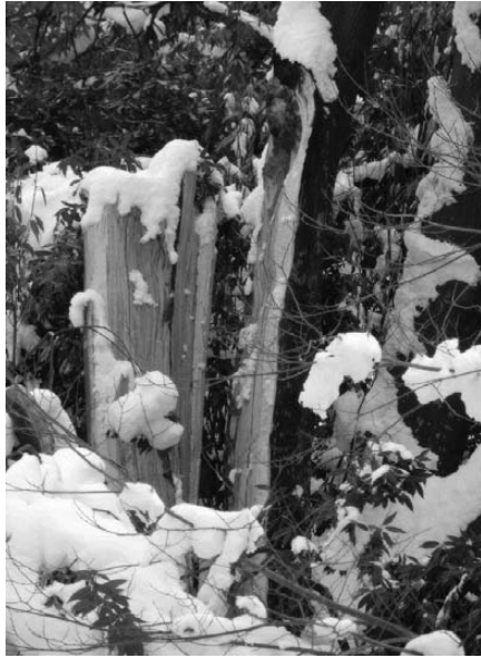
凍み割れシラカシ

平成二十九年一月十四日から十六日にかけて上山は極寒、降雪甚だしく武家屋敷、みゆき公園の松や権現堂のしだれ桜など地域に多くの被害をもたらしました。山形地区気象状況は一月十五日雪、最高マイナス3℃、最低マイナス7℃、気温実測では最低がマイナス8℃でした。観音寺境内の桜、イチイなど枝折れが多く、「シラカシ」は上部枝分岐点より凍み割れして太枝二本が北側、東側に枝折れ倒壊し、敷地建造物を損壊しました。このまま放置するとひび割れが大きくなって残った主木が庫裡を直撃破壊