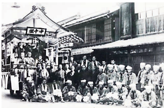
中十日町屋台改築記念昭和9年8月播磨屋芸妓連・播磨屋前

訳や年代は不明です。踊り易く、観易くなったと思われます。この屋台の一番の特長は破風