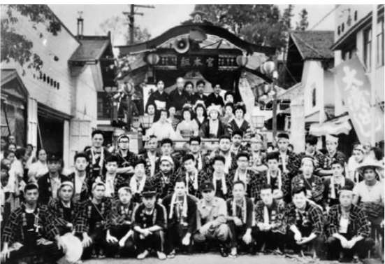
昭和36年9月24日(中) 宮本組、矢来組合同