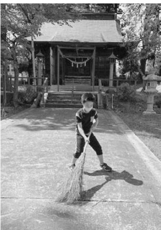
孫の石崎神社掃除

ンジのような探究心があったならもう少しましな人間になっていただろうかと反省する事しきりですが、後の祭り。更なる書物は『上山郷土史抄』昭和五年発行武田昭蔵著で『その他、江戸中期には、京都の祇園祭の様な山車(山鉦)が城下町を練り歩き疫病を払うという夏祭りが行はれたけれど藩主の交代で永続させず、廃絶したのもある』とあります。えっ？『おでんの様』の祭りの事？