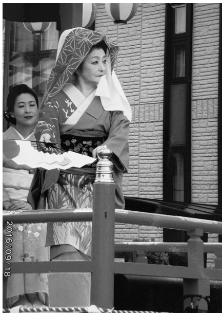
山車で舞う筆者（2016年9月18日撮影）

へおどろいたおどろいたのははじまりで、上山の踊り山車 だし 、 私も二十五年間赤堀つる叟会の踊り山車屋台で踊りまし た。男衆が引張る山車屋台の上で踊るのは何とも言われな い気持ちのよい楽しい一日でした。山形舞妓が参加するま では山車一台だったので朝七時から夜九時まで一日中踊り 通しでした。日本髪を結 かむ って、簪 かんざし つけて、白塗り化粧をして、 着物を着ると誰だかわからないくらい化けて、皆若くなっ