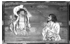
上山藩御用絵師丸野清耕「蝦蟇鉄拐図」

※参照:「宋元仏画」(京博特別展図録)、「武田喜八郎著作集」、「上市市史」、資料集「御傳記」①ほか。 ※歴代藩主順を変更して「月刊かみのやま」300最終号(賛)特別稿とします。