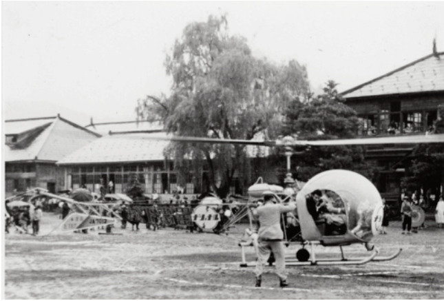
“ナショナル号” いま、まさに着陸