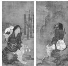
元代顔輝作蝦蟇・鉄拐図

上山の魂、文芸伝統は、「月刊かみのやま」に受け継がれ、豊かさを、掘り下げ、絆を、紡ぎ、街に灯りをかかげてきた。だけなく、書き手自身の裡に潜む象を、刻み、晒し、過去化することで成長させつけた。 わたしたちは、それを未来に託していきたい……。